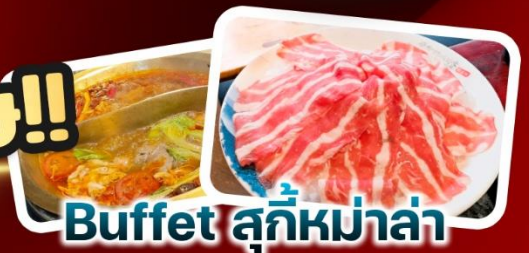
Buffet สุกี้หม่าล่า