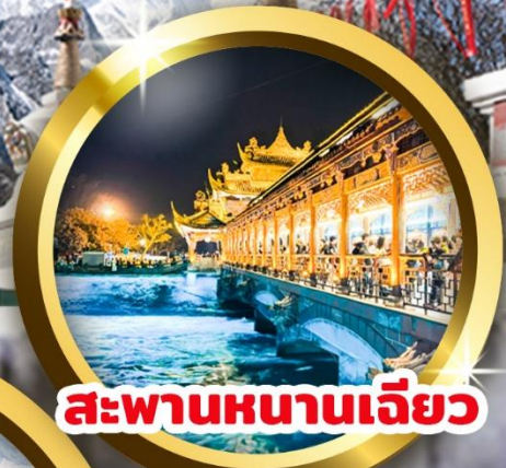
สะพานหนานเจียว