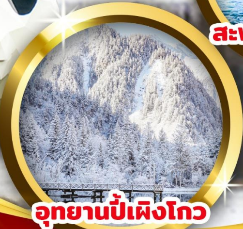
อุทยานปี้เฟิงโกว